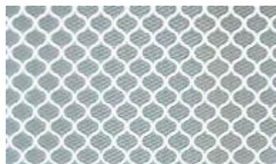
Abbildung 1 - Zellenstruktur und Verarbeitungsrichtungen

ORALITE® 6910 Brilliant Grade ist erhältlich in den Farben Weiß (010), Gelb (020), Orange (035), Rot (030), Grün (060) Blau (050) und Braun (080) sowie in den fluoreszierenden Standardverkehrsfarben Gelb fluoreszierend (037), Gelb-grün fluoreszierend (029) und Orange fluoreszierend (038). Die Tagesaufsichtfarben, gemessen gemäß den einschlägigen Spezifikationen der CIE Nr. 15.2, entsprechen Tabelle 3 und 4 und sollen die Werte gemäß DIN 6171-1: 2011-11 erfüllen. Zu Informationszwecken werden auch die fluoreszierenden Leuchtdichtefaktoren angegeben.