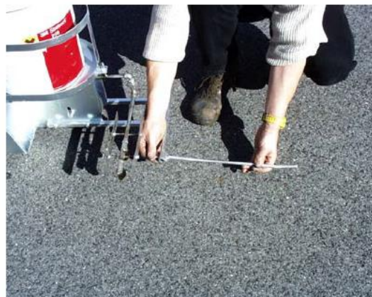
Justieren des Visiers