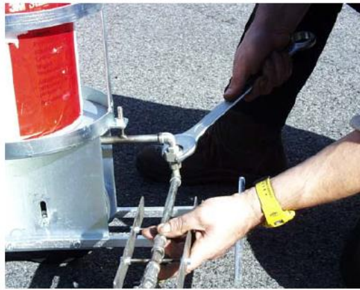
Festziehen des Sprüharms