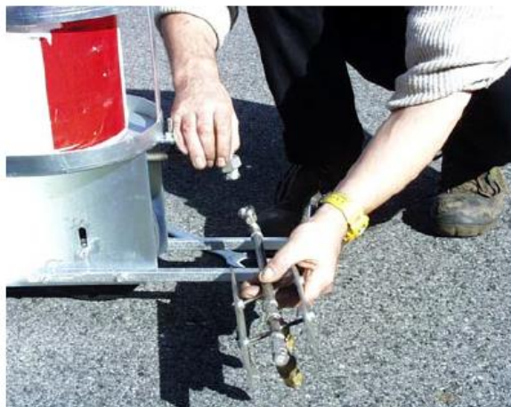
Anschrauben des Sprüharms