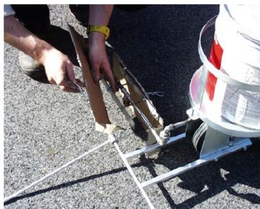
Anbringen des Sprühschutzkartons

Der Sprühschutzkarton verringert die Luftzugeinflüsse beim Sprühen und unnötiges Verschmutzen des Gerätes.